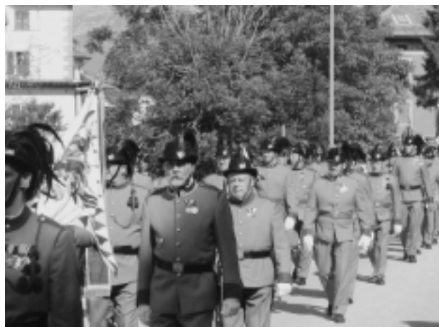
La prima sezione italiana della «Tiroler-Kaiserjaegerbund» costituita a Lavarone

Il gruppo di Lavarone veste una divisa meravigliosa, quella ufficiale dei Kaiserjäger, la se-